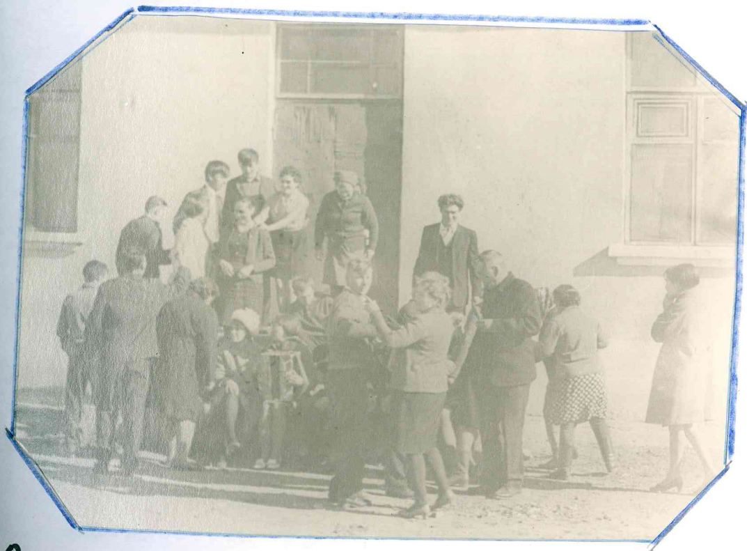
Открытие восьмилетней школы. 1965г.