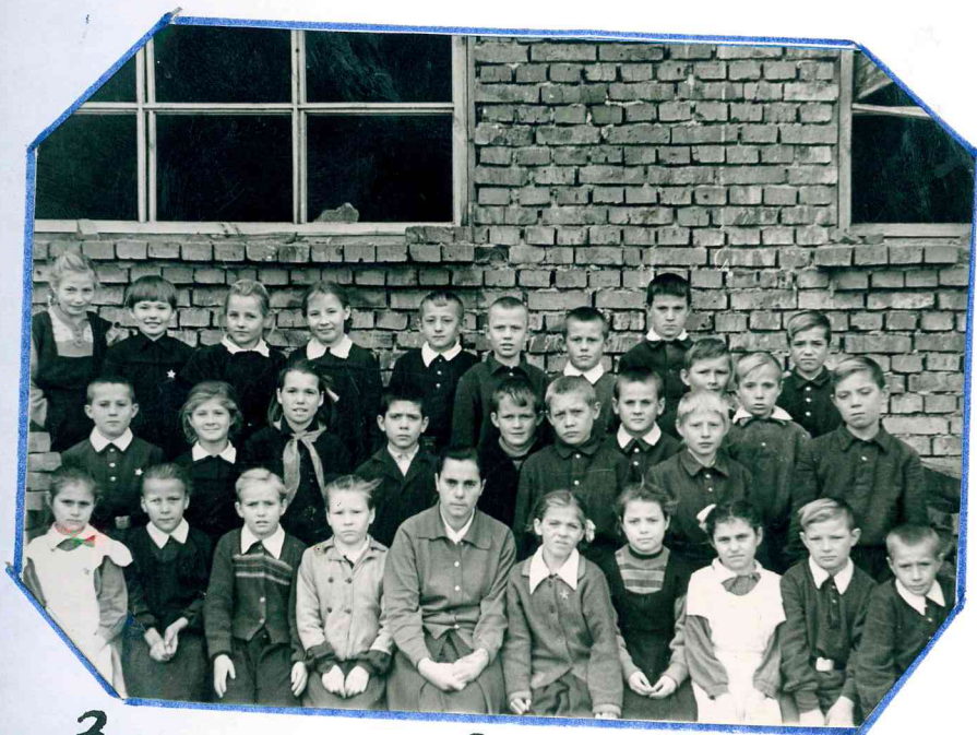
Здание восьмилетней школы, построен. 1965 г.