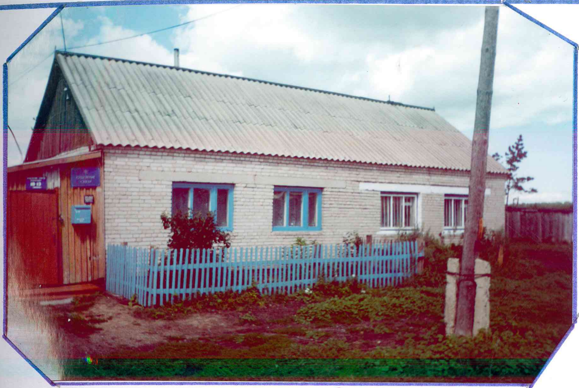
Отделение связи с. Кожевниково, построено 1975г.