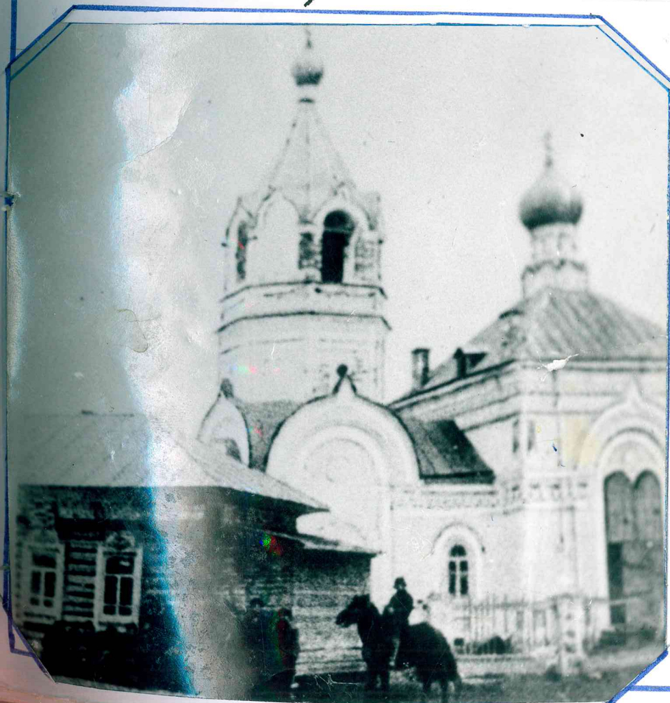
Церковно- приходская церковь.

В 1939 году церковь снесли, кирпич перевезли на строительс- тво Новоярковской больницы.