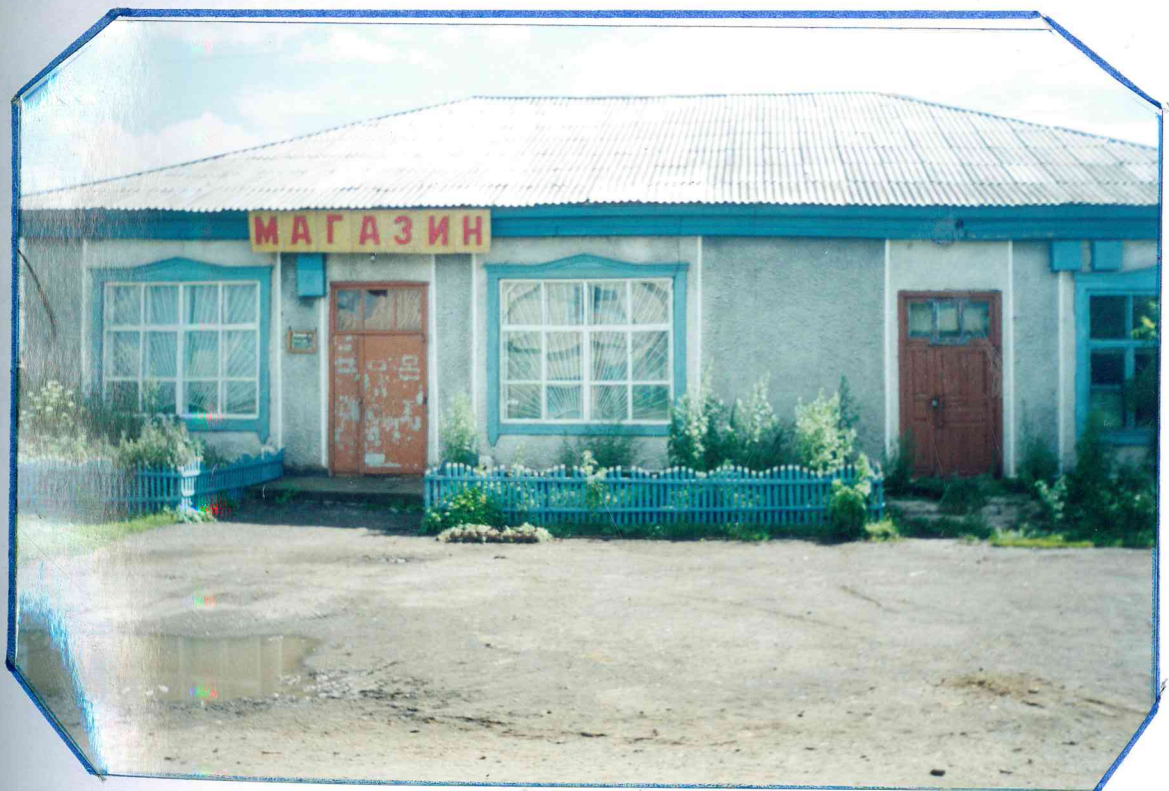
Магазин построен в 1961г.