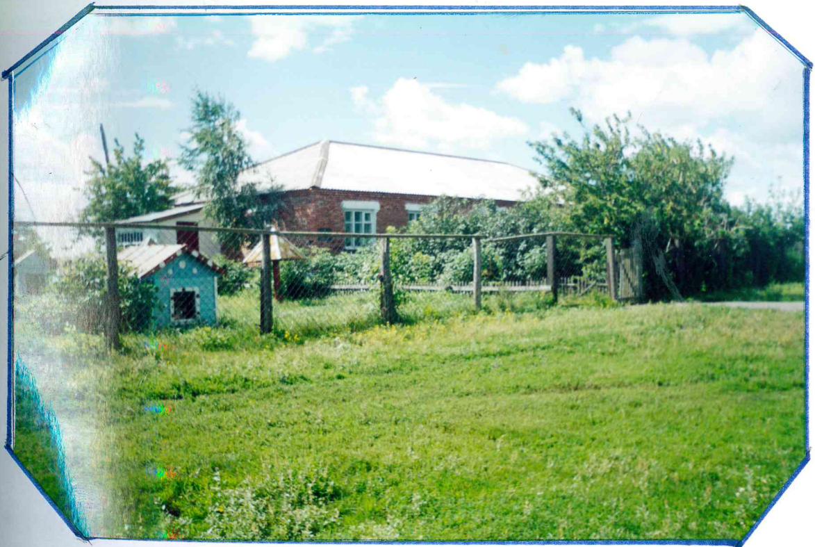
Тросторный детский сад с игровой площадкой для детей, построен в 1982 году. В этой же здании находится медпункт.