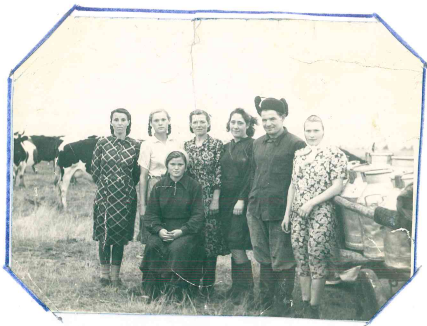
Бригада в 9 Районного зурта, 1954г.