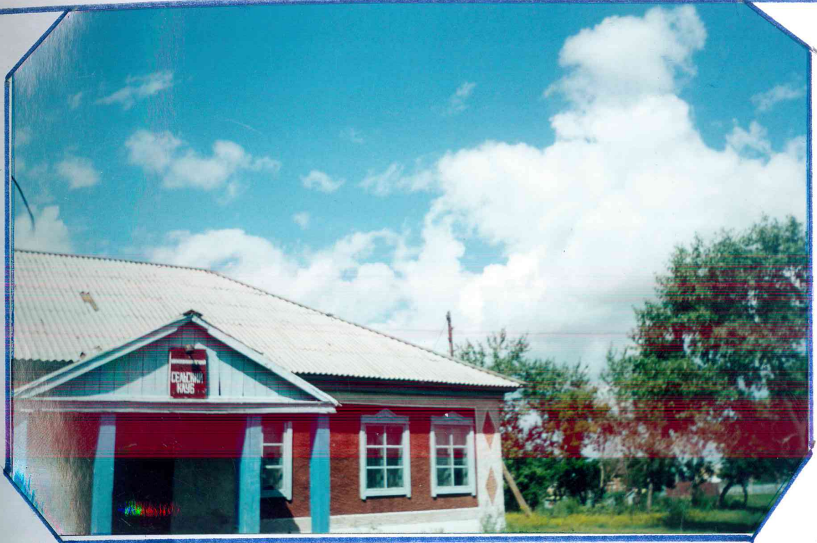
Козевниковский сельский клуб построен 1957 г.